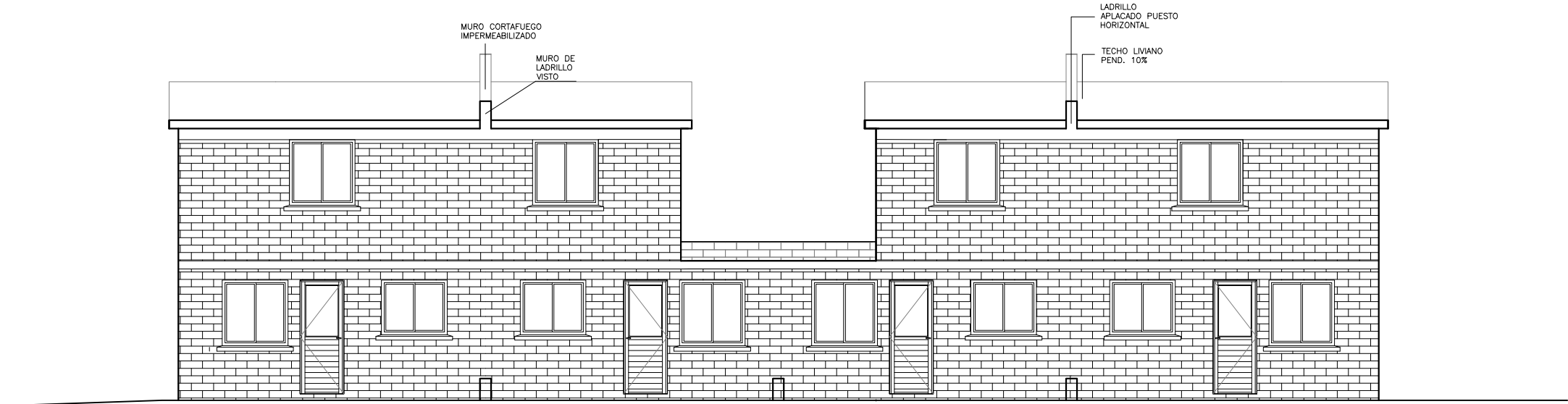
BLOQUE H- FACHADA POSTERIOR ESC. 1/100