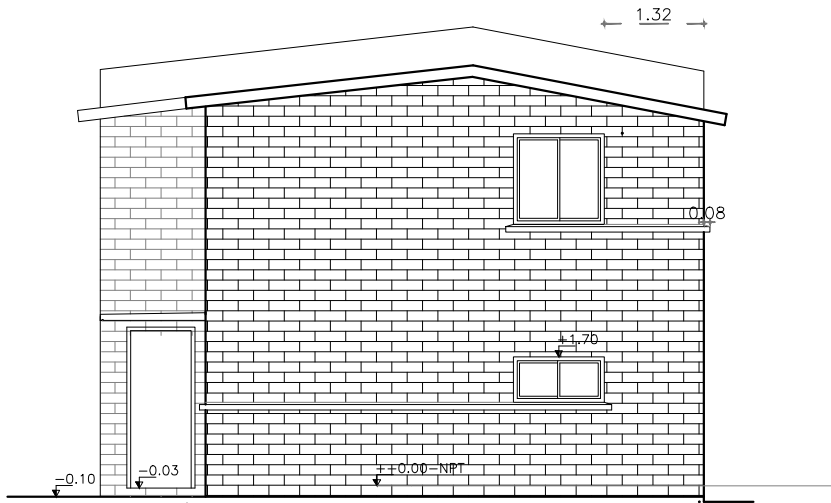
BLOQUE H- FACHADA LATERAL ESC. 1/100